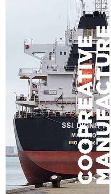
台中港4a碼頭 2020連和航運發電機協助工程

日租：當租用不足月租條件時，以日租計算。 月租：租用超過第一個月，而未滿兩個月時，則以平均月租金額計算以上報價不包含運費、發電機用油、營業稅5%。 如須連續運轉24小時：須租用兩台交替使用或租金費用另計。 吊車運費部份：卸貨只限車邊位置。 發電機承租期間：機械操作由租方人員負責，保養與修護由敝公司派人負責。 付款方式：敝公司於每月底計算使用日數後送發票請款(100%)