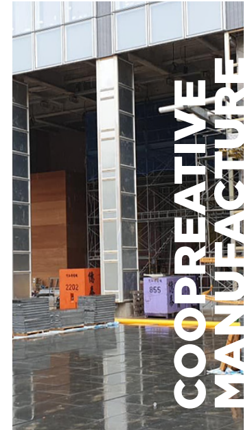
中壽台北學苑營建 2019中鹿營造發電機協助工程

日租：當租用不足月租條件時，以日租計算。 月租：租用超過第一個月，而未滿兩個月時，則以平均月租金額計算以上報價不包含運費、發電機用油、營業稅5%。 如須連續運轉24小時：須租用兩台交替使用或租金費用另計。 吊車運費部份：卸貨只限車邊位置。 發電機承租期間：機械操作由租方人員負責，保養與修護由敝公司派人負責。 付款方式：敝公司於每月底計算使用日數後送發票請款(100%)