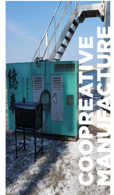
VESTAS 漢諾威風力發電 2020 VESTAS 漢諾威風力發電協助工程